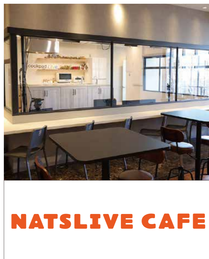
3F NATSLIVE CAFE NATSLIVE CAFE 表参道