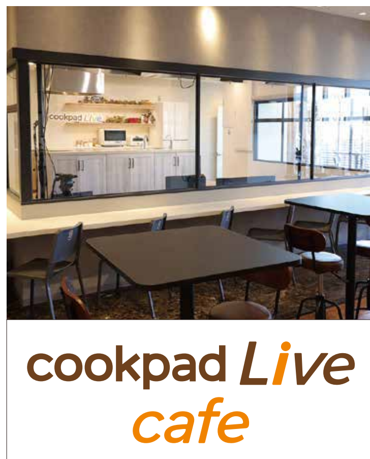
3F cookpad Live cafe cookpadLive cafe 表参道