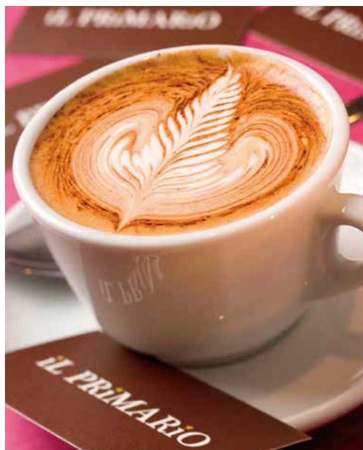
B1 il PRiMARiO イルプリマリオ

※詳しいセール期間や内容は各店にお問い合わせください。※内容は予告無しに変更する場合があります。