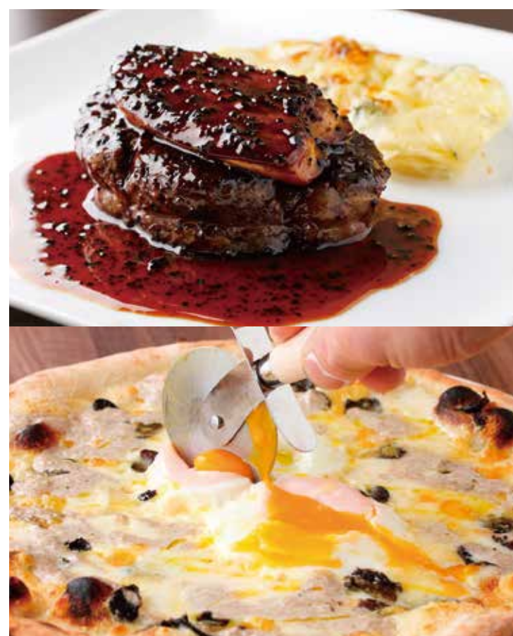
1F 俺のフレンチ・イタリアン 青山