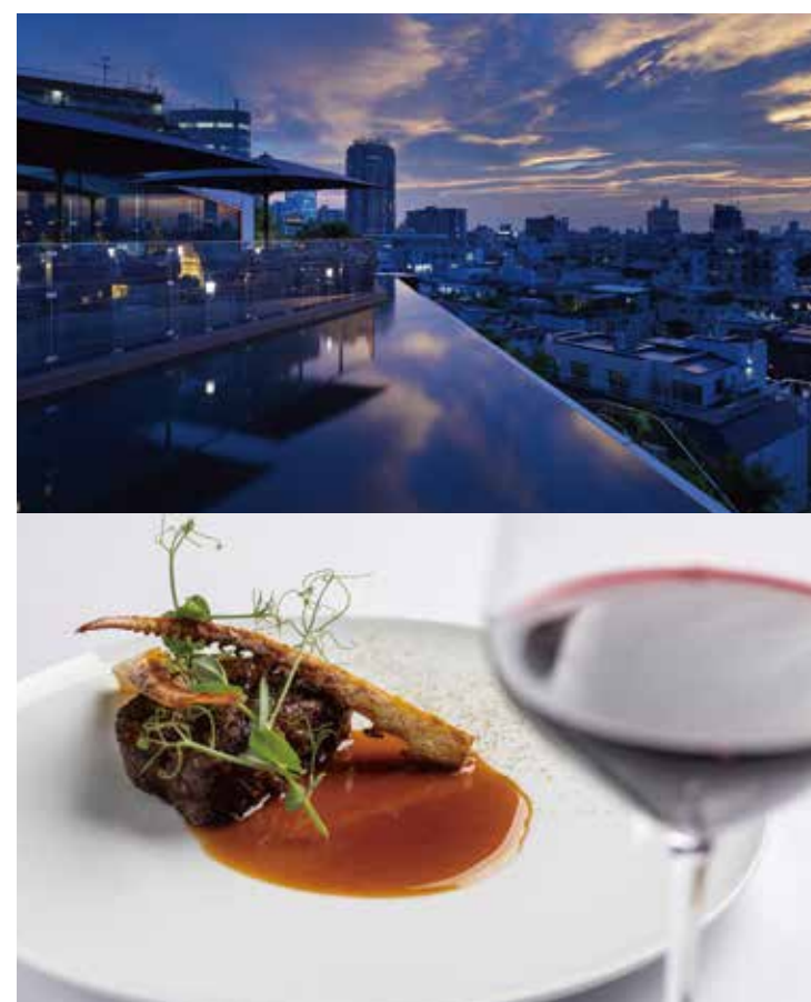
5F TWO ROOMS GRILL | BAR TWO ROOMS GRILL | BAR